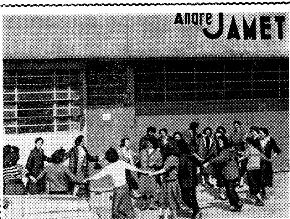
Pendant une récente grève victorieuse contre les cadences à Grenoble, les jeunes filles font une ronde...

Mais, il nous reste à prendre des mesures d'organisation nécessaires à tous les échelons pour contribuer au renforcement de ces mouvements de masse ; cela est possible si toutes les organisations