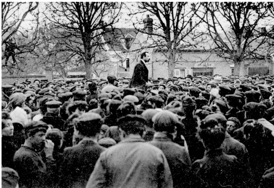
Louis Niel s'adresse à la foule des grévistes de Méru, le 14 avril 1909.

avaient profité : « [Les réformistes] n'ont agi, n'ont obtenu des résultats – journée de neuf heures, droit syndical, retraites ouvrières des chemins de fer, etc. – que par l'action menée par les éléments révolutionnaires. » Et Merrheim de conclure à la nécessité de sortir d'une crise, qui n'est qu'une « crise de domestication », en gagnant à tous les niveaux d'organisation l'indépendance matérielle, c'est-à-dire le dégagement de toute tutelle municipale ou gouvernementale, l'objectif final étant que « les militants apprennent à mieux discerner la contingence des théories et les nécessités de la pratique et, examinant les faits, l'évolution scientifique et industrielle de tous les jours, adaptent leur action à cette évolution pour en tirer le maximum de résultats. »